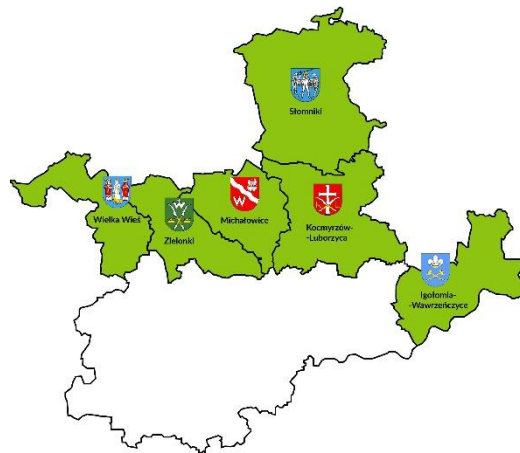
Rysunek 1: Mapa obszaru objętego LSR

Poniżej, na rysunku 1 przedstawiona jest mapa wykazująca spójność przestrzenną obszaru objętego LSR z zaznaczeniem granic poszczególnych gmin wchodzących w skład LGD.