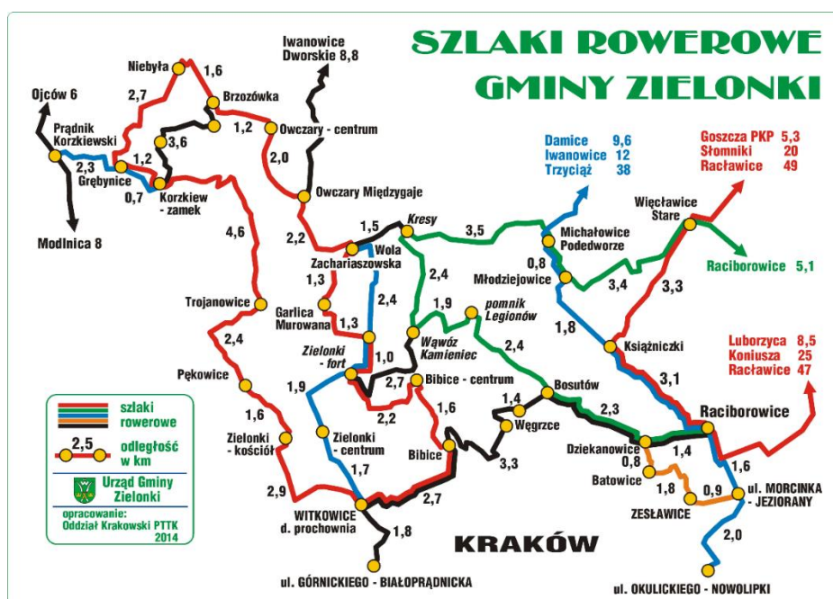
Rysunek 4: Przykład opracowania sieci szlaków rowerowych z terenu LGD

W gminach Zielonki i Wielka Wieś jest bardzo dobrze rozwinięta sieć szlaków rowerowych i pieszych, przebiegających po urozmaiconych, malowniczych terenach. Dostępne są liczne wydawnictwa promocyjne, mapy i przewodniki turystyczne. Obecnie na obszarze LGD istnieje około 300 km oznakowanych tras turystycznych (w tym około 12 km ścieżek rowerowych), funkcjonuje tutaj także 35 zarejestrowanych gospodarstw agroturystycznych, jednak liczba realnie funkcjonujących i przyjmujących turystów jest znacznie niższa.