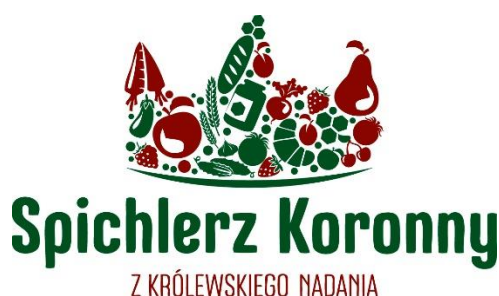
Rysunek 5: Logotyp Marki Lokalnej Spichlerz Koronny

Bardzo ważne z punktu widzenia rozwoju produktów lokalnych jest wprowadzona w 2018r. Marka Lokalna „Spichlerz Koronny”. Marka ta ma przypisany odpowiednio prowadzony proces certyfikacji, dzięki któremu znak marki otrzymują lokalne produkty najwyższej jakości. Po czterech edycjach naboru wniosków w skład grona wyróżnionych Znakiem Marki „Spichlerz Koronny” wchodzi: 23 podmioty, a wraz z nimi w portfolio Marki znajduje się ponad 30 produktów spożywczych, 7 produktów użytkowych, 4 produkty rękodzielnicze, 3 usługi i jedno lokalne wydarzenie. Marka ta staje się coraz bardziej rozpoznawalna wśród klientów, gdyż producenci wprowadzają oznakowanie produktów logo Marki i w trakcie sprzedaży eksponują statuetki Marki. Jednak aby realne rozpoznawanie produktów certyfikowanych, a tym samym realny wpływ Marki „Spichlerz Koronny” na wybory zakupowe klientów były zdecydowanie większe LGD musi ponieść nakłady na odpowiednią promocję i wsparcie rozwoju Marki, dlatego niniejsza LSR przewiduje dedykowane Marce „Spichlerz Koronny” przedsięwzięcie, w ramach którego zostaną sfinansowane nie tylko materialne narzędzia promocyjne, ale także powstaną materiały do promocji w prasie, telewizji i internecie, co z pewnością realnie zwiększy rozpoznawalność tego znaku jakości.