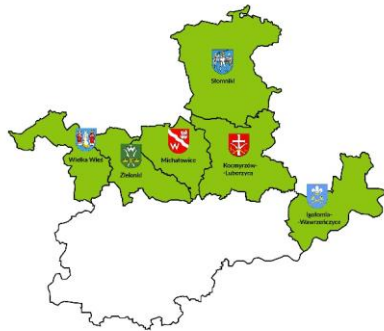
Rysunek 1: Mapa obszaru objętego LSR

Poniżej, na rysunku 1 przedstawiona jest mapa wykazująca spójność przestrzenną obszaru objętego LSR z zaznaczeniem granic poszczególnych gmin wchodzących w skład LGD.