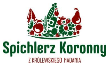
Rysunek 5: Logotyp Marki Lokalnej Spichlerz Koronny

Bardzo ważne z punktu widzenia rozwoju produktów lokalnych jest wprowadzona w 2018r. Marka Lokalna „Spichlerz Koronny”. Marka ta ma przypisany odpowiednio prowadzony proces certyfikacji, dzięki któremu znak marki otrzymują lokalne produkty najwyższej jakości. Po czterech edycjach naboru wniosków w skład grona wyróżnionych Znakiem Marki „Spichlerz Koronny” wchodzi: 23 podmioty, a wraz z nimi w portfolio Marki znajduje się ponad 30 produktów spożywczych, 7 produktów użytkowych, 4 produkty rękodzielnicze, 3 usługi i jedno lokalne wydarzenie. Marka ta staje się coraz bardziej rozpoznawalna wśród klientów, gdyż producenci wprowadzają oznakowanie produktów logo Marki i w trakcie sprzedaży eksponują statuetki Marki. Jednak aby realne rozpoznawanie produktów certyfikowanych, a tym samym realny wpływ Marki „Spichlerz Koronny” na wybory zakupowe klientów były zdecydowanie większe LGD musi ponieść nakłady na odpowiednią promocja i wsparcie rozwoju Marki, dlatego niniejsza LSR przewiduje dedykowane Marce „Spichlerz Koronny” przedsięwzięcie, w ramach którego zostaną sfinansowane nie tylko materialne narzędzie promocyjne, ale także powstaną materiały do promocji w prasie, telewizji i internecie , co z pewnością realnie zwiększy rozpoznawalność tego znaku jakości .