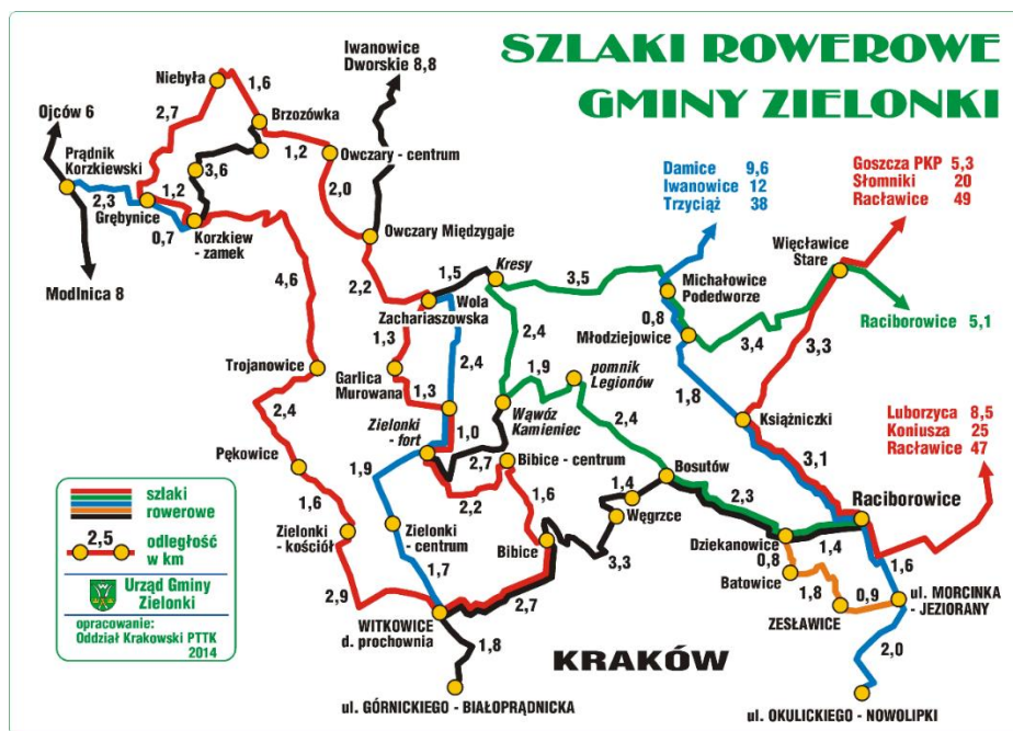
Rysunek 4: Przykład opracowania sieci szlaków rowerowych z terenu LGD

W gminach Zielonki i Wielka Wieś jest bardzo dobrze rozwinięta sieć szlaków rowerowych i pieszych, przebiegających po urozmaiconych, malowniczych terenach. Dostępne są liczne wydawnictwa promocyjne, mapy i przewodniki turystyczne. Obecnie na obszarze LGD istnieje około 300 km oznakowanych tras turystycznych (w tym około 12 km ścieżek rowerowych), funkcjonuje tutaj także 35 zarejestrowanych gospodarstw agroturystycznych, jednak liczba realnie funkcjonujących i przyjmujących turystów jest znacznie niższa.