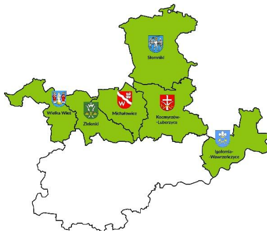
Rysunek 1: Mapa obszaru objętego LSR

Poniżej, na rysunku 1 przedstawiona jest mapa wykazująca spójność przestrzenną obszaru objętego LSR z zaznaczeniem granic poszczególnych gmin wchodzących w skład LGD.