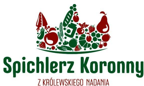
Rysunek 5: Logotyp Marki Lokalnej Spichlerz Koronny

Bardzo ważne z punktu widzenia rozwoju produktów lokalnych jest wprowadzona w 2018r. Marka Lokalna „Spichlerz Koronny”. Marka ta ma przypisany odpowiednio prowadzony proces certyfikacji, dzięki któremu znak marki otrzymują lokalne produkty najwyższej jakości. Po czterech edycjach naboru wniosków w skład grona wyróżnionych Znakiem Marki „Spichlerz Koronny” wchodzi: 23 podmioty, a wraz z nimi w portfolio Marki znajduje się ponad 30 produktów spożywczych, 7 produktów użytkowych, 4 produkty rękodzielnicze, 3 usługi i jedno lokalne wydarzenie. Marka ta staje się coraz bardziej rozpoznawalna wśród klientów, gdyż producenci wprowadzają oznakowanie produktów logo Marki i w trakcie sprzedaży eksponują statuetki Marki. Jednak aby realne rozpoznawanie produktów certyfikowanych, a tym samym realny wpływ Marki „Spichlerz Koronny” na wybory zakupowe klientów były zdecydowanie większe LGD musi ponieść nakłady na odpowiednią promocję i wsparcie rozwoju Marki, dlatego niniejsza LSR przewiduje dedykowane Marce „Spichlerz Koronny” przedsięwzięcie, w ramach którego zostaną sfinansowane nie tylko materialne narzędzie promocyjne, ale także powstaną materiały do promocji w prasie, telewizji i internecie, co z pewnością realnie zwiększy rozpoznawalność tego znaku jakości.