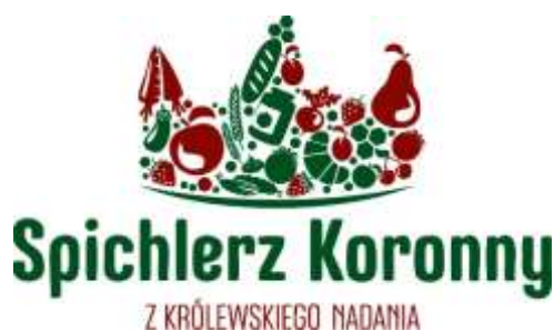
Rysunek 5: Logotyp Marki Lokalnej Spichlerz Koronny

Bardzo ważne z punktu widzenia rozwoju produktów lokalnych jest wprowadzona w 2018r. Marka Lokalna „Spichlerz Koronny”. Marka ta ma przypisany odpowiednio prowadzony proces certyfikacji, dzięki któremu znak marki otrzymują lokalne produkty najwyższej jakości. Po czterech edycjach naboru wniosków w skład grona wyróżnionych Znakiem Marki „Spichlerz Koronny” wchodzi: 23 podmioty, a wraz z nimi w portfolio Marki znajduje się ponad 30 produktów spożywczych, 7 produktów użytkowych, 4 produkty rękodzielnicze, 3 usługi i jedno lokalne wydarzenie. Marka ta staje się coraz bardziej rozpoznawalna wśród klientów, gdyż producenci wprowadzają oznakowanie produktów logo Marki i w trakcie sprzedaży eksponują statuetki Marki. Jednak aby realne rozpoznawanie produktów certyfikowanych, a tym samym realny wpływ Marki „Spichlerz Koronny” na wybory zakupowe klientów były zdecydowanie większe LGD musi ponieść nakłady na odpowiednią promocję i wsparcie rozwoju Marki, dlatego niniejsza LSR przewiduje dedykowane Marce „Spichlerz Koronny” przedsięwzięcie, w ramach którego zostaną sfinansowane nie tylko materialne narzędzie promocyjne, ale także powstaną materiały do promocji w prasie, telewizji i internecie, co z pewnością realnie zwiększy rozpoznawalność tego znaku jakości.